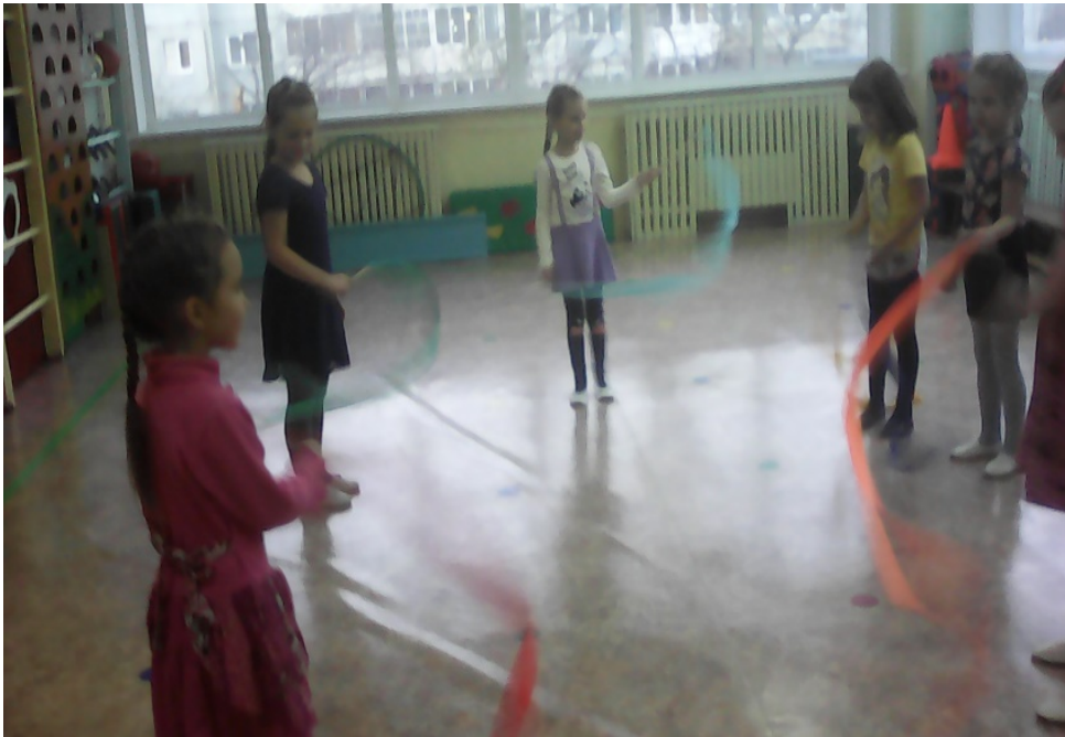
Утренние гимнастики для девочек.