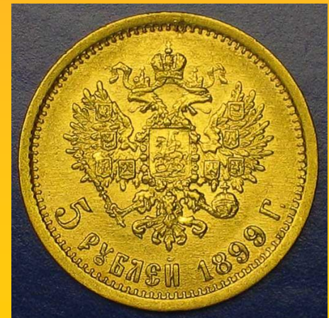
Золотые 5 рублей 1899 г. реверс