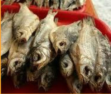
Сушёная рыба (Исландия)