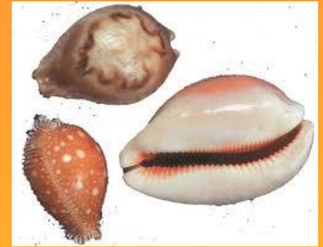
Раковины Каури (Приморье)