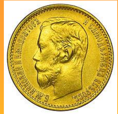
Золотые 5 рублей 1899 г. аверс